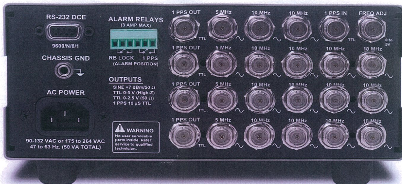
Рисунок 2 – задняя панель прибора*